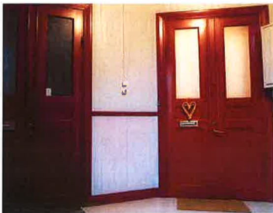
Gamla spegeldörrar är vackra men ger inget bra brandskydd. Skyddet kan dock förbättras genom att man förstärker dörrarna på insidan.