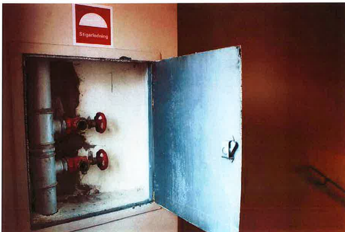
Via stigarledningen i trapphuset får räddningstjänsten vattenförsörjning utan att behöva dra slangar hela vägen från bottenvåningen.