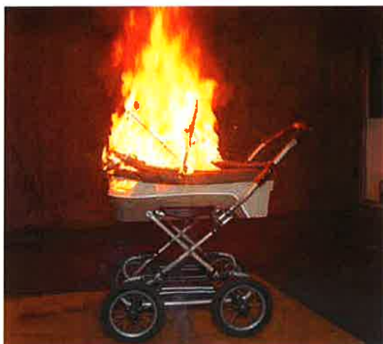
Håll trapphuset fritt från brännbart material och sådant som är i vägen vid en utrymning.

uthyrningen är det lämpligt att den som hyr ut lokalen för en dialog med hyresgästen om hur brandskyddet är tänkt att fungera när det gäller utrymningsvägar, tillåtet antal personer, eventuella larm med mera. I vissa fall kan det också vara lämpligt att tillsammans gå igenom lokalen/lokalerna innan de tas i bruk för arrangemanget. Det bör också finnas någon form av skriftlig brandskyddsinformation och checklista till hyresgästen. Sådana bör också vara uppsatta i lokalen.