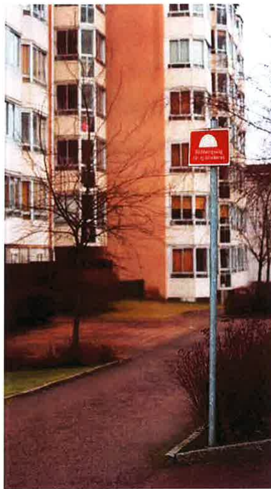
Räddningsvägar ska hållas snöröjda och fria från andra hinder.

Garage förses lämpligast med pulversläckare eftersom pulver är effektivt mot motorbränder. En sådan fungerar på de flesta typer av bränder och kan användas även för övriga utrymmen. Handbrandsläckare riskerar att bli stulna. Vill man ha släckutrustning i allmänna utrymmen kan vattenslang på rulle i ett fast skåp vara ett bra alternativ.