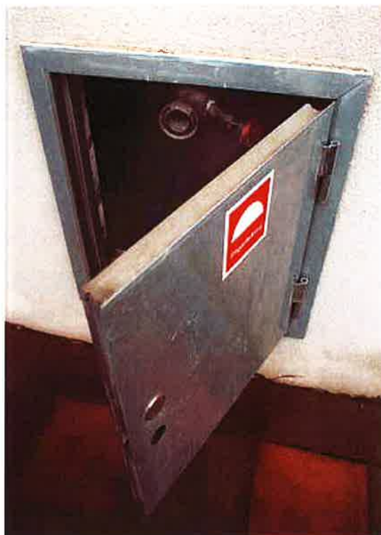
I stigarledningen i luckan på fasaden kan räddningstjänsten koppla in vatten. Inne i trapphuset finns sedan uttag där slangar kan anslutas.

I trapphus utgörs brandventilationen ibland av vanliga öppningsbara fönster. Det är viktigt att se till att lekande barn inte kan falla genom dessa. För att hindra olyckor kan exempelvis ett utvändigt galler användas.