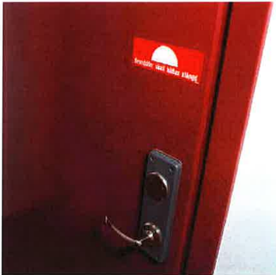
Det är mycket viktigt att branddörrar hålls stängda. De får inte ställas upp med kilar eller dylikt.