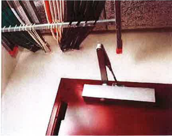
Hål som tas upp i brandcellsgräns, för till exempel dragning av ledningar, måste tätas ordentligt. Dörrstängare får inte hakas av.