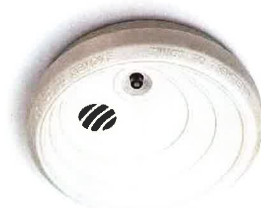
Det ska finnas minst en uppsatt och fungerande brandvarnare i varje lägenhet. Billigare liv- och egendomsförsäkring är svårt att hitta.

brandvarnare installeras, men att de boende sedan själva ansvarar för att regelbundet prova att den fungerar och byta batterier vid behov.