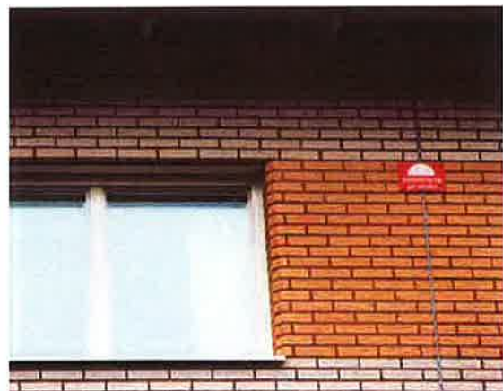
Tips: Om byggnaden har brandsektionerad vind är det en bra idé att ha skyltar med texten "Sektionering på vinden" uppsatta på fasaden där sektioneringarna finns. Då ser räddningstjänsten direkt var de är.

Observera att brandsäkerheten i äldre trähus vanligtvis är mycket sämre eftersom dörrar och väggar inte är utformade för att klara en brand på samma sätt som i nyare byggnader. Exempelvis kan en brand snabbt ta sig genom en tunn spegeldörr i trä. Har dörren dessutom glasrutor, kan branden sprida sig ännu fortare. I sådana hus är brandskyddet särskilt viktigt. Eventuellt bör förstärkningsåtgärder övervägas. En sådan kan vara att byta ut eller förstärka lägenhetsdörrarna.