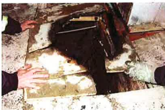
Felaktigt hanterad aska är en vanlig brandorsak. Här har golvet brunnit när aska från en kakelugn som det eldats i dagen före ställts i en plastpåse på golvet.

Bränder i bostäder är ofta eldstadsrelaterade. Därför är det viktigt att uppmärksamma säkerheten kring eldstäder. De boende behöver informeras om vad som gäller för de lokala eldstäder som finns i fastigheten, exempelvis kakelugnar och öppna spisar. Viktig information är om det får eldas i dessa, vad som i så fall får eldas, i vilken omfattning det får eldas och hur askan ska hanteras.